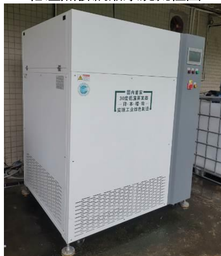
低溫蒸發濃縮技術裝置