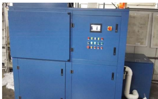
脈衝式布袋過濾裝置

萬誠雖然已採用環保方式進行生產，現時車間內從油墨，水漕液及清潔劑中仍然釋放出VOC揮發性有機物，平均濃度約140ppm造成車間空氣污染。萬誠現時主要從印刷車間抽氣，透過活性炭吸附空氣中VOC，去除率約30-40%效果不明顯。現時每三個月更換一次活性炭，數量約2-3噸，費用約人民幣25,000，因此企業計劃對VOC處理技術進行升級改造。