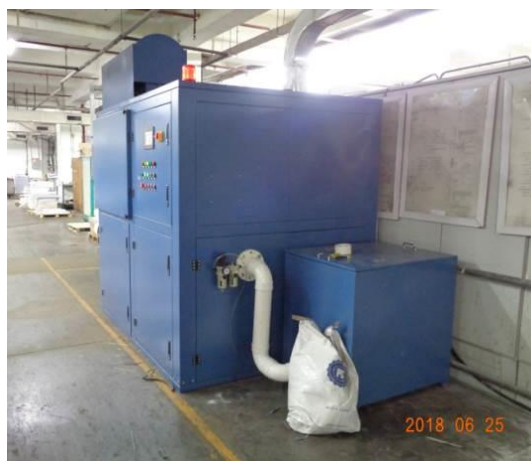
脈衝式布袋過濾裝置（入粉側）