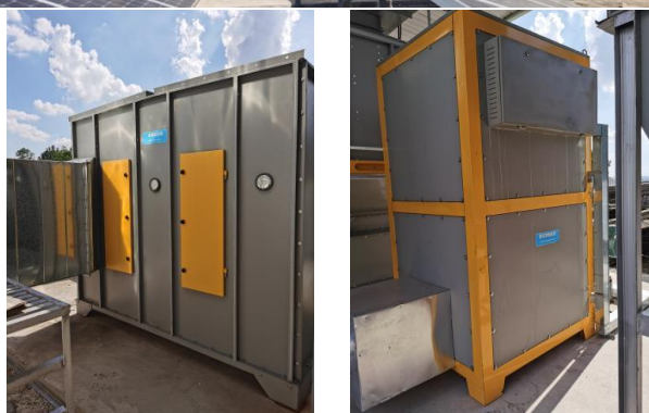
活性炭吸附浓缩及催化燃烧组合设备