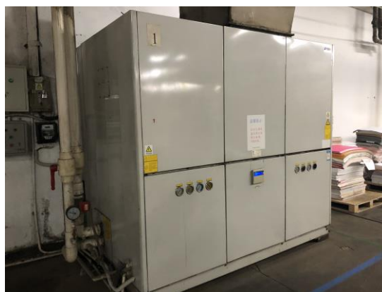
水冷式空调空装《温度平衡技术》