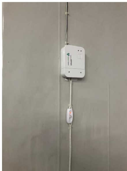
制冷温度平衡系统