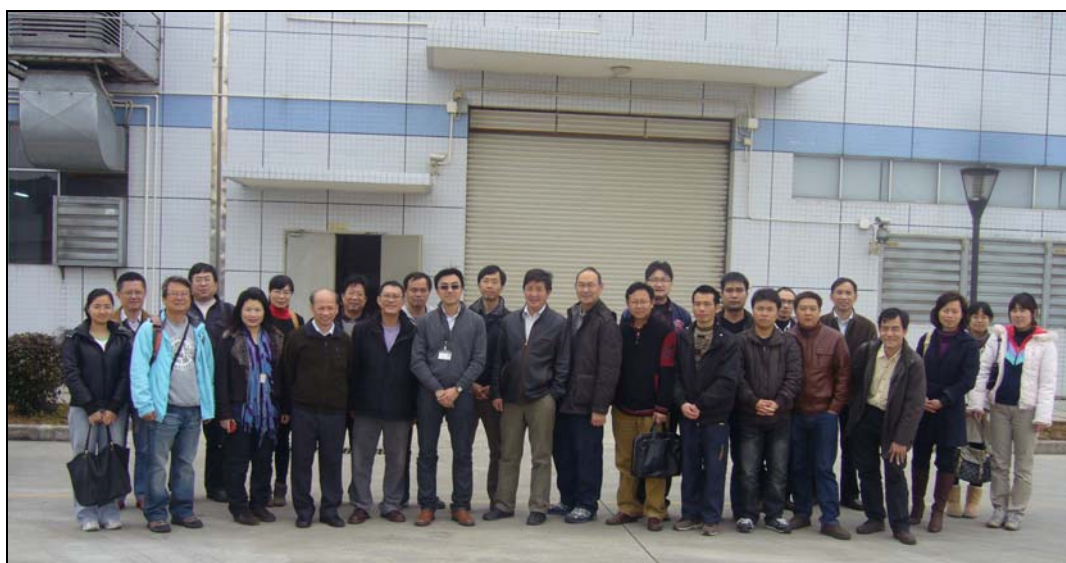
清潔生產伙伴計劃於 2011 年 2 月 22 日參觀精英塑膠（珠海）有限公司