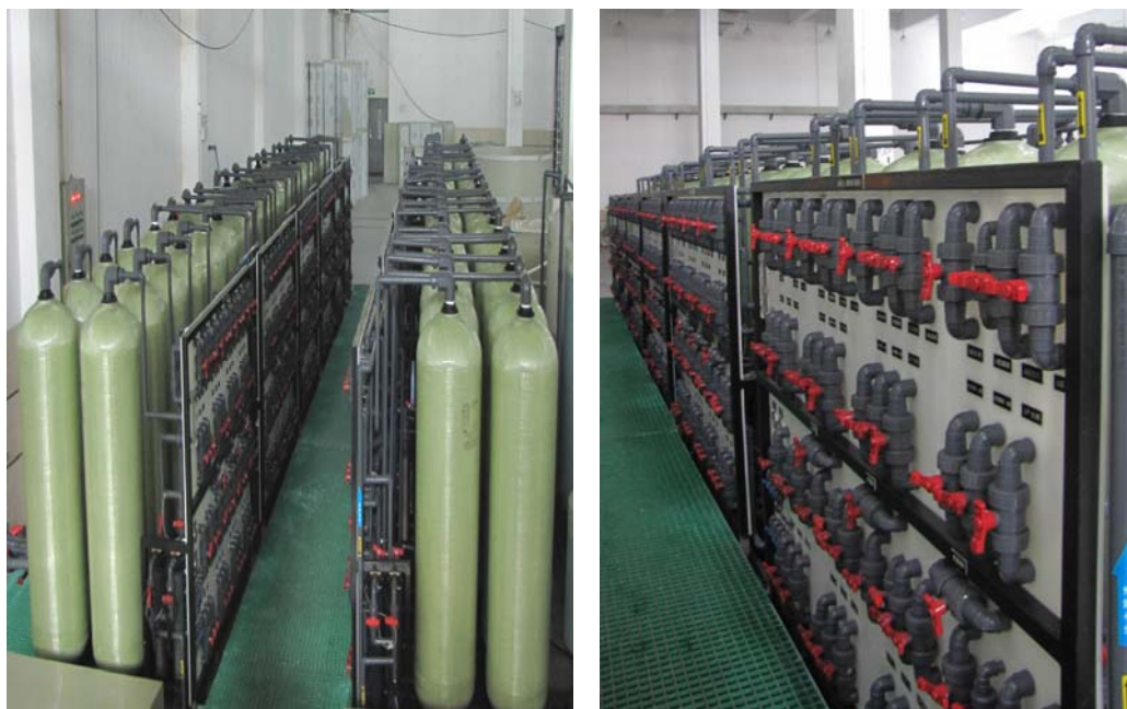
「電鍍廢水離子交換回用系統」