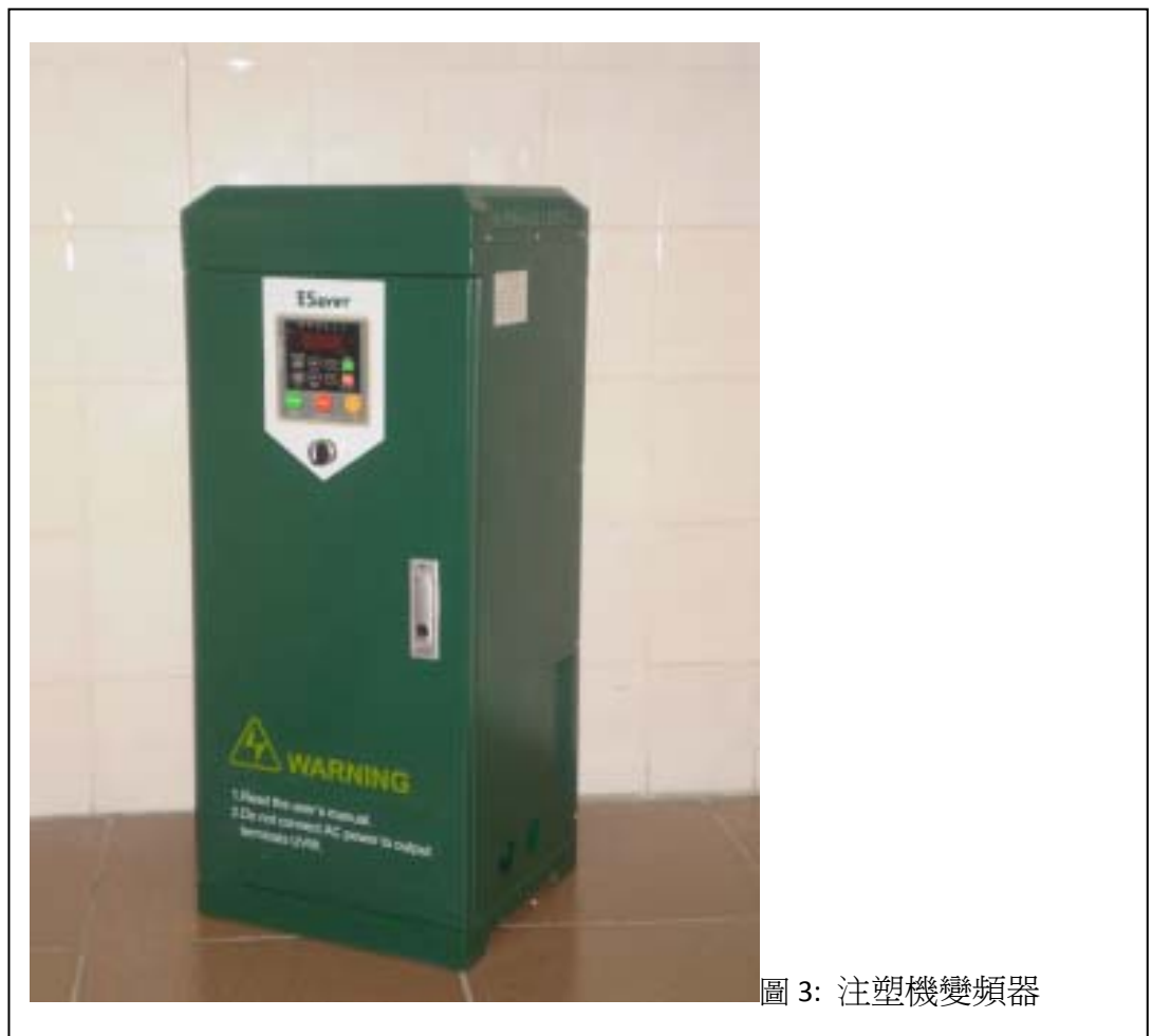
圖 3: 注塑機變頻器

利材參與「清潔生產伙伴計劃」示範項目，成功獲得資助，開展了「變頻調速節能系統」項目。將注塑機原有的定量泵系統改變為變頻變數泵系統。變頻器因應不同負荷來調整液壓泵電源的輸入頻率，改變其運作速度，使油泵的實際供油量與注塑機的運作流量需求一致，達致節電效果。