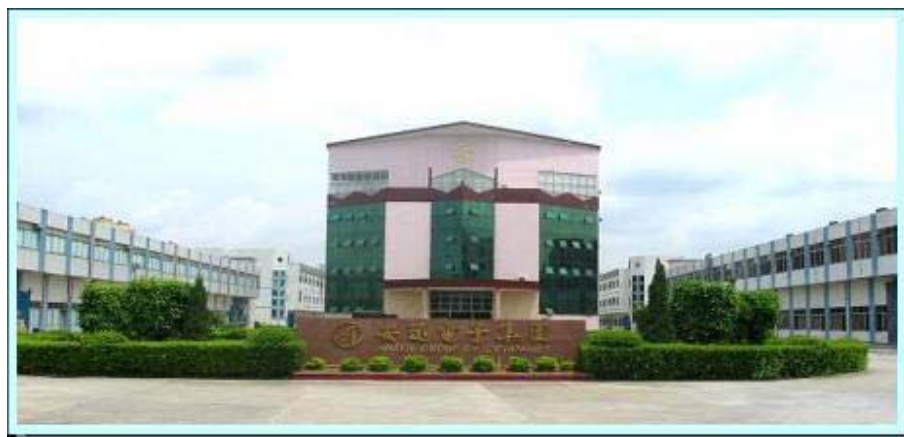
圖 1：東莞橋頭嶺頭利材塑膠模具廠房

利材塑膠製品廠於 1989 年成立，集團總部設於香港，並擁有東莞橋頭嶺頭利材塑膠模具廠(簡稱：利材)，主要生產塑膠製品及配件，工廠員工約 250 人。